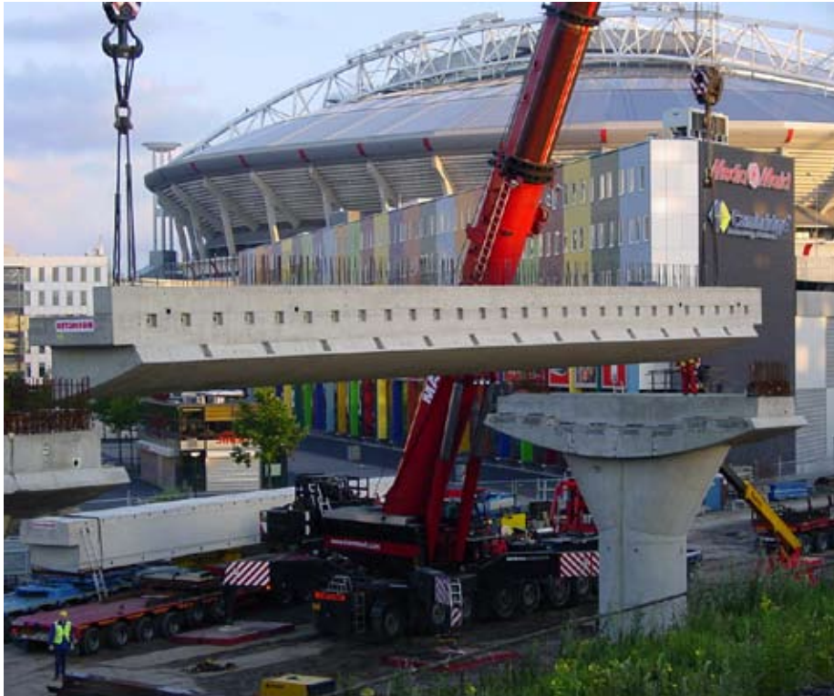
Betonligger voor NS station Bijlmer-Arena